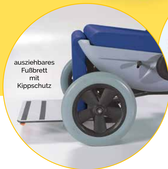
ausziehbares Fußbrett mit Kippschutz