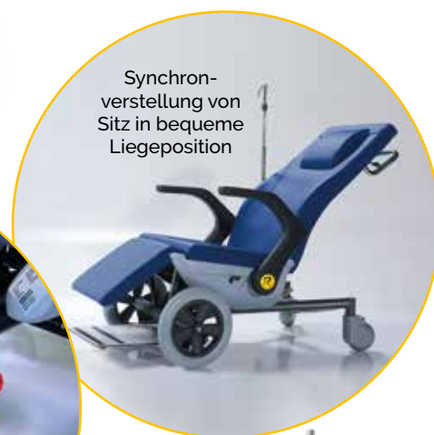
Synchron- verstellung von Sitz in bequeme Liegeposition